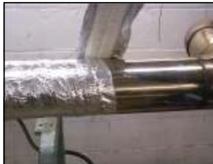
Facil de manejo