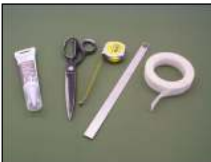
Sin herramientas especiales

Además de una cinta métrica, una regla y tijeras no se necesitan herramientas especiales para su instalación.