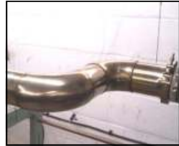
Tubo antes de la instalación

Para la instalación no se necesitan herramientas especiales: sólo una cinta métrica, una regla y tijeras. Esta guía está completamente ilustrada, fácil de seguir y también acompañada en cada envío.