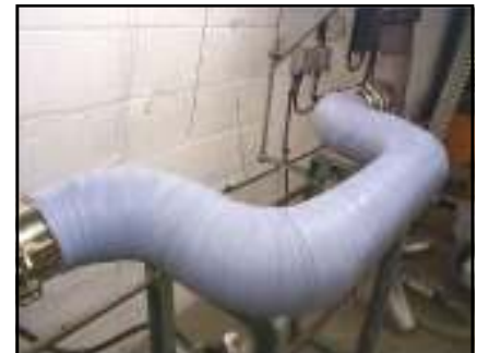
Capa de seguridad con autofijación