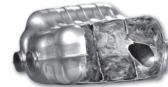
Absorptionsmaterialien für Abgasschalldämpfer