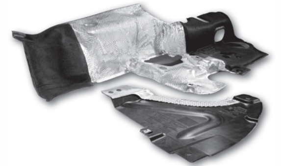
Hitzeschilde, Stanz- und Umformteile